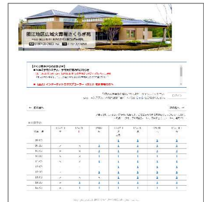
【火葬予約システムトップ画面】

登録葬儀業者に依頼するとWeb予約システムによって24時間火葬場の使用予約ができますので、登録葬儀業者による予約登録完了後、火葬場予約通知書をお受け取りください。(システムメンテナンス時間は除く)